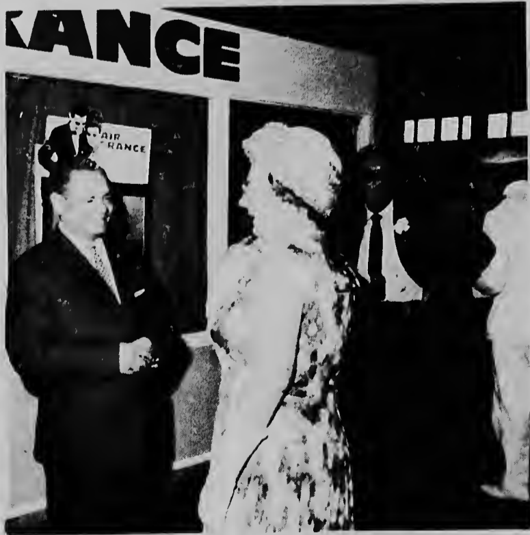
Aki La Reina Juliana ta gradici e hefe di RVD, señor H.L. Braam, pa locual e cu su colaboradornan a hasi pa laga e bishita tuma lugar lo mas exitoso posibel.

Gulyashki no a duna di conoctrama di e historia cu e heroe nobo di ficcion lo biba, pero ta ser sperá cu lo e pone Bond den bon aprieto.